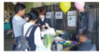
パルシステム埼玉 白岡センター 青空市に出店の様子

「プリユ葬」を実現するためには、思いを受け止め、理解し合えるパートナーが必要です。そこで、埼玉県内で活動している生協に理解ある葬祭会社が集まり、「葬祭事業協同組合 埼玉こすもす」を発足させました。以来、「パルシステム埼玉」の理念と思いを、「葬祭事業協同組合 埼玉こすもす」が受け止めて具体化し、安心なお葬式を施行しています。